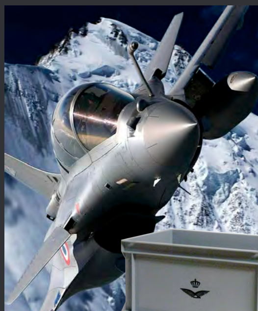
En in de lucht